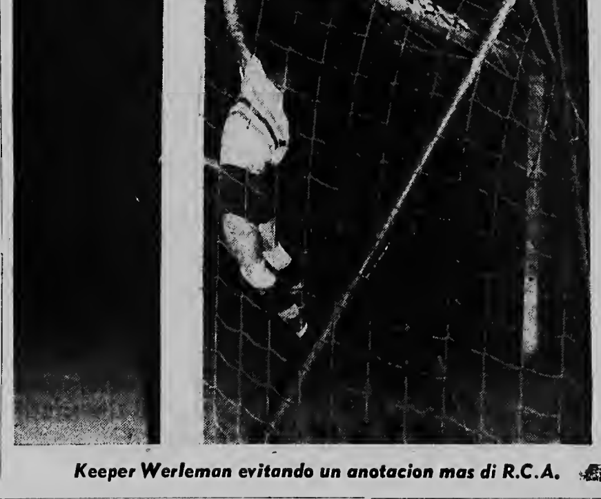
Keeper Werleman evitando un anotacion mas di R.C.A.

SANTA CRUZ. — Diamars merdia banda di diesdos or M.G. di San Fuego a llega cas bon burachi. Cu na mes tempo tabata tin un enfermera den cas ta drechando morto di su ruman no a stroba el di revolva tur e cas. Nan a serc na warla di polis mientrastanto.